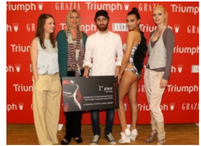
Jury mit Sieger Detailansicht

http://www.themenportal.de/audio/shape-sensation-unterwaesche-von-jungen-designern-bringt-sie-perfekt-in-form-beitrag