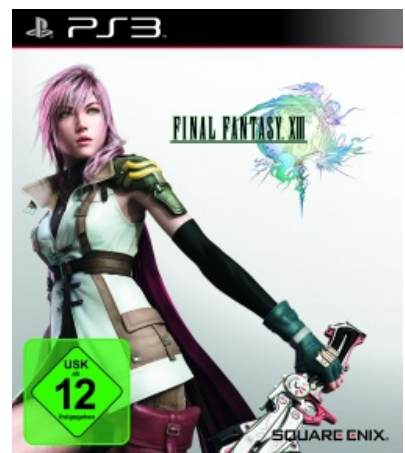
FINAL FANTASY XIII Detailsicht